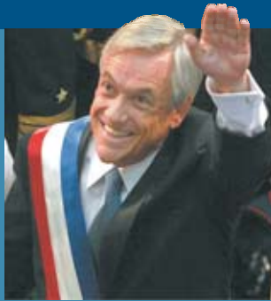
Sebastián Piñera