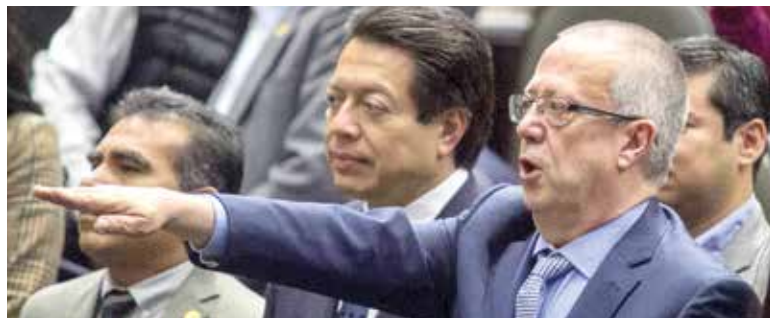
CARLOS URZÚA. Primer secretario de Hacienda en ser ratificado por el Congreso.